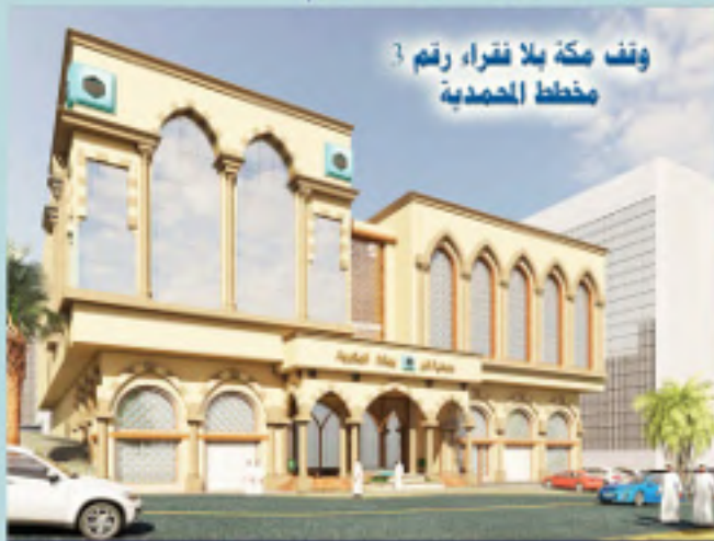
وقف مكة بلا فقراء رقم ٣ مخطط المحمدية

في خطوة مباركة لواحد من أهم المشاريع الاستثمارية العملاقة التي تنفذها جمعية البر بمكة المكرمة ، سيقوم صاحب السمو الملكي الأمير خالد الفيصل مستشار خادم الحرمين الشريفين أمير منطقة مكة المكرمة - بإذن الله - بتدشين مشروع وقف مكة بلا فقراء رقم (٢) ورقم (٣) ، وذلك يوم الاثنين ٢٨ / ٦ / ١٤٣٨ هـ بمكتب سموه في ديوان الإمارة بمكة المكرمة ، هذا ما صرح به سعادة رئيس مجلس إدارة جمعية البر بمكة المكرمة الأستاذ الدكتور طارق بن صالح جمال ، مبيناً أهمية هذه المشاريع الاستثمارية الضخمة التي تأتي ضمن سلسلة من المشاريع الخيرية الوقفية الكبرى التي أنجزتها جمعية البر بمكة المكرمة انطلاقاً من وقف مكة بلا فقراء رقم (١) وهو عبارة عن عمارة بحي العزيزية،