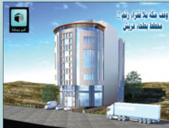
وقف مكة بلا فقراء رقم ٢ مخطط بطحاء قريش