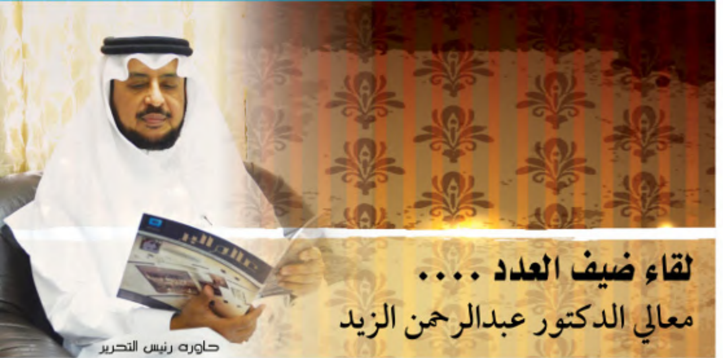
حاوره رئيس التحرير