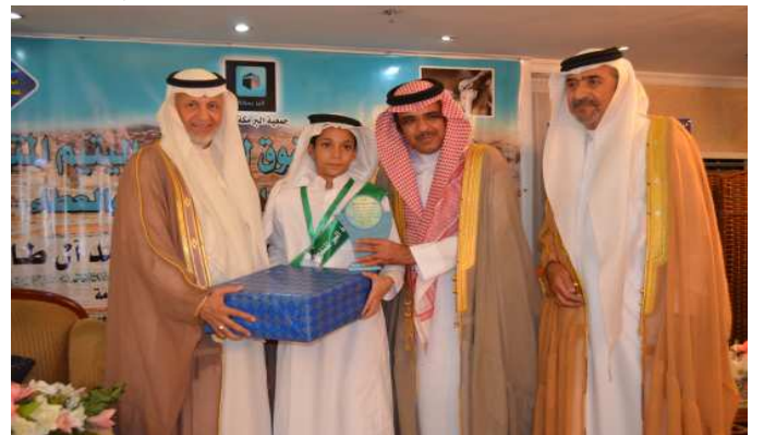
تكريم أحد الطلاب الأيتام المتفوقين