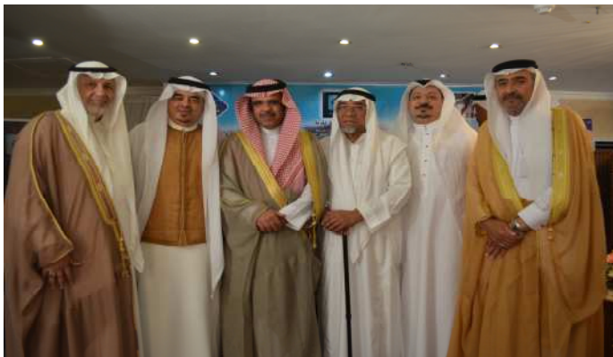
لقطة تذكارية لبعض أعضاء مجلس إدارة جمعية البر بمكة المكرمة مع مدير عام الشؤون الاجتماعية بمنطقة مكة المكرمة