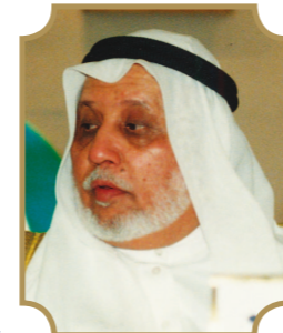
معالي د. محمد عبده يمانى رحمه الله

وعضو شرف الجمعية وداعمها المخلص معالي الدكتور محمد عبده يمانى والذي فقدناه أواخر عام ١٤٢١هـ (حاصل على شهادة الدكتوراه في الجيولوجيا من إحدى الجامعات الأمريكية، وعمل محاضراً بعدد من الجامعات السعودية ثم مديراً لجامعة الملك عبدالعزيز ثم وزيراً للإعلام من ١٣٩٥ إلى ١٤٠٣هـ، وله ٣٥ مؤلفاً، بعضها باللغة الإنجليزية، تناول من خلالها مواضيع علمية ودينية وثقافية مختلفة)