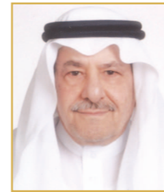
سعادة الشيخ هشام عطار