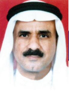
ستون عاماً من البر والعطاء