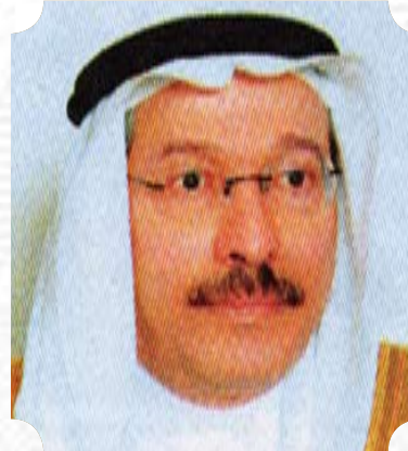
صاحب المعالي الأستاذ عبد المحسن العكاس وزير الشؤون الاجتماعية