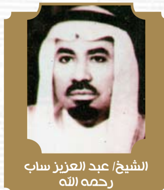
الشيخ/ عبد العزيز ساب رحمه الله