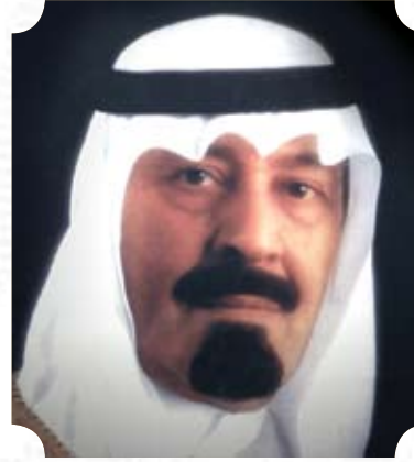
خادم الحرمين الشريفين الملك عبد الله بن عبد العزيز آل سعود