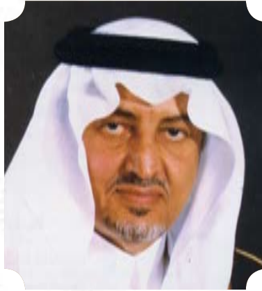
صاحب السمو الملكي الأمير خالد الفيصل بن عبد العزيز آل سعود أمير منطقة مكة المكرمة