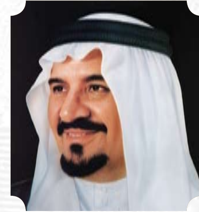
صاحب السمو الملكي الأمير سلطان بن عبد العزيز آل سعود ولي العهد ونائب رئيس مجلس الوزراء ووزير الدفاع والطيران والمفتش العام