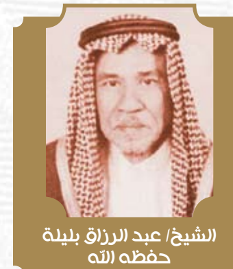
الشيخ/ عبد الرزاق بليلة حفظه الله