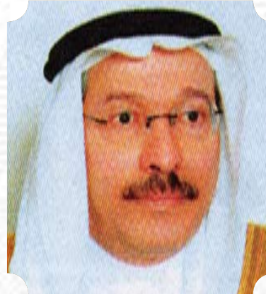
صاحب المعالي الأستاذ عبد المحسن العكاس وزير الشؤون الاجتماعية